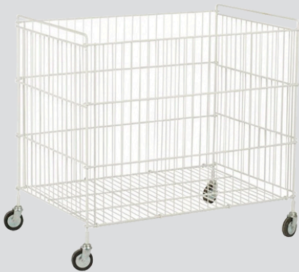
CS-115 / 212 / 365